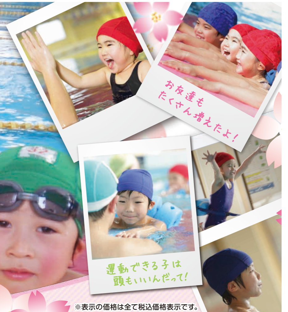
お友達もたくさん増えたよ!